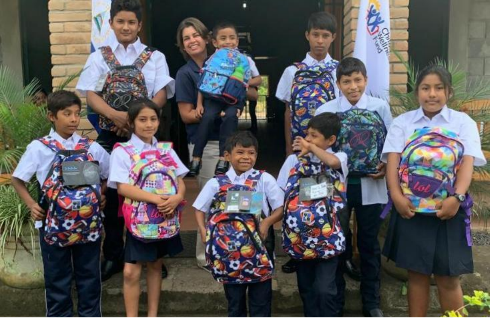
Entrega de uniformes y mochilas a menores beneficiarios de Basurero La Joya