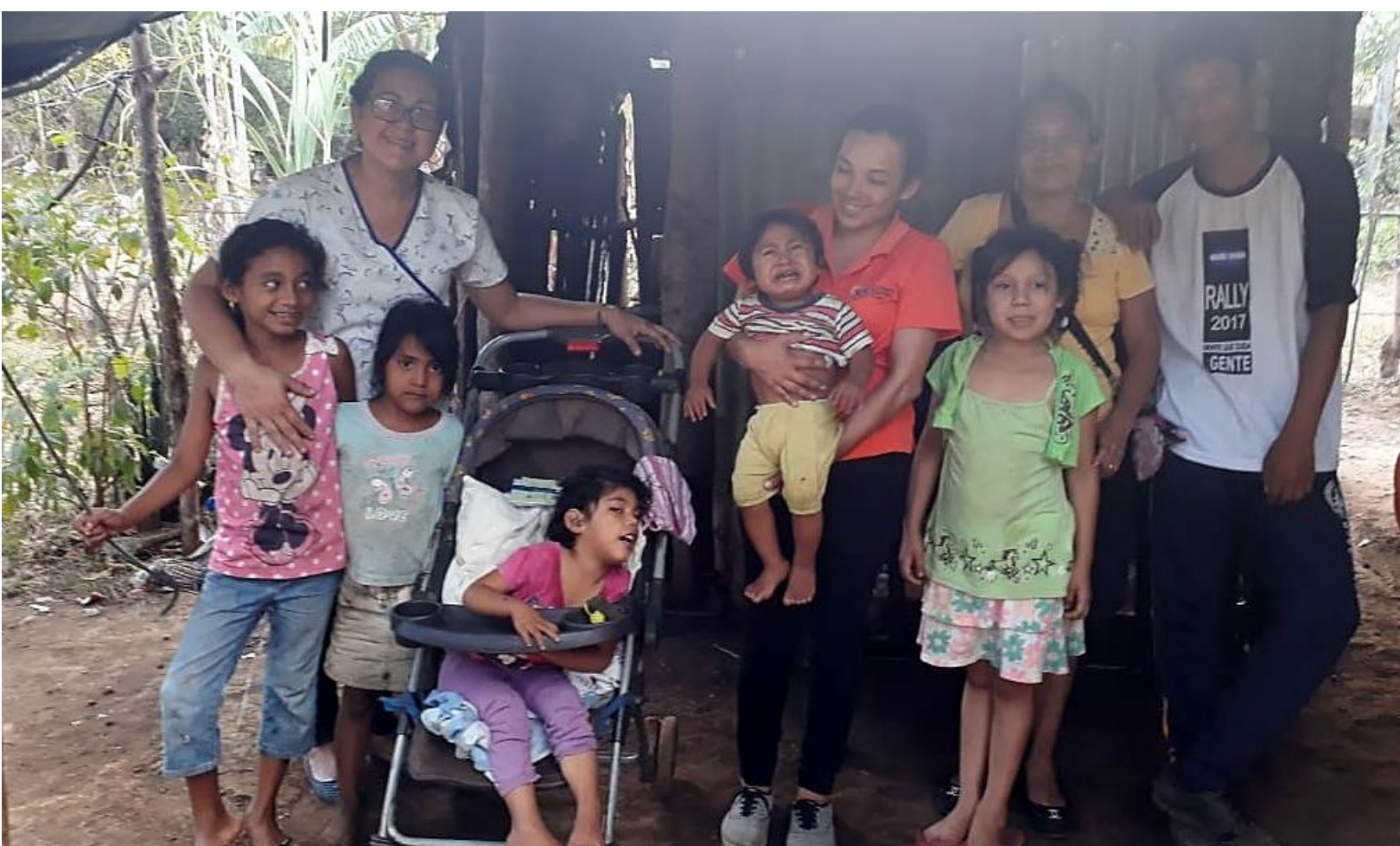
Visitas domiciliarias de nuestro personal de salud a menores con discapacidad en su Comunidad

De igual forma, fueron beneficiados (6) Niños con Discapacidad con Fórmulas Lácteas y 62 niños mensualmente con Paquetes Nutricionales a base de Leche de Soya, Cereales y Carne de Soya, con el objetivo de contribuir a mejorar su estado nutricional.