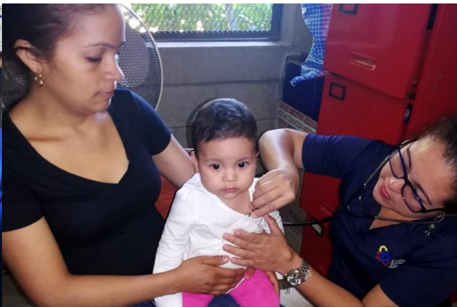
Atención en el programa de Vigilancia y promoción del crecimiento y desarrollo, incluida la aplicación de vacunas a menores según edad y requerimiento de las mismas.