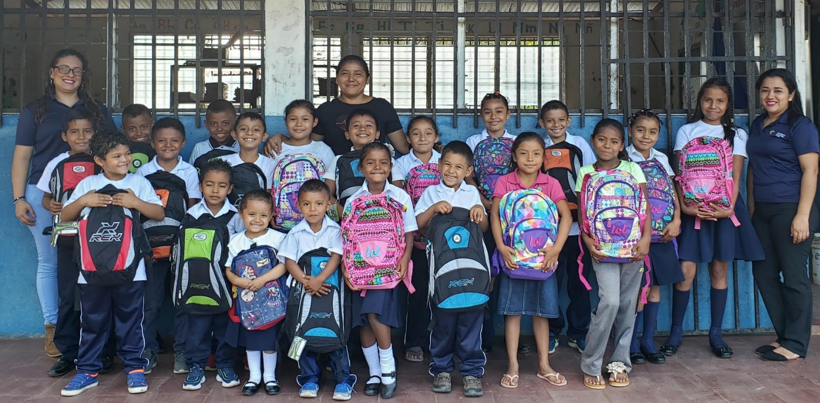
Personal Administrativo de Children's Wellness Fund en entrega de mochilas a menores de Escuela Santa Ana en Comunidad El Manchón