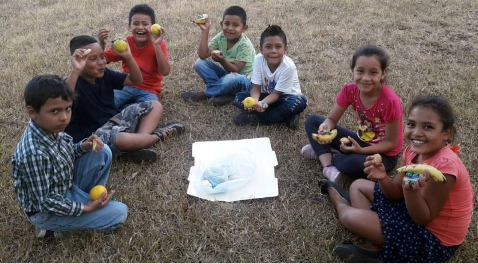
Actividades desarrolladas al aire libre como parte de la clase de inglés. Arriba: Picnic con el tema de nombres de frutas. Abajo: Excursión a uno de los Miradores de la Comunidad con el tema La Naturaleza.