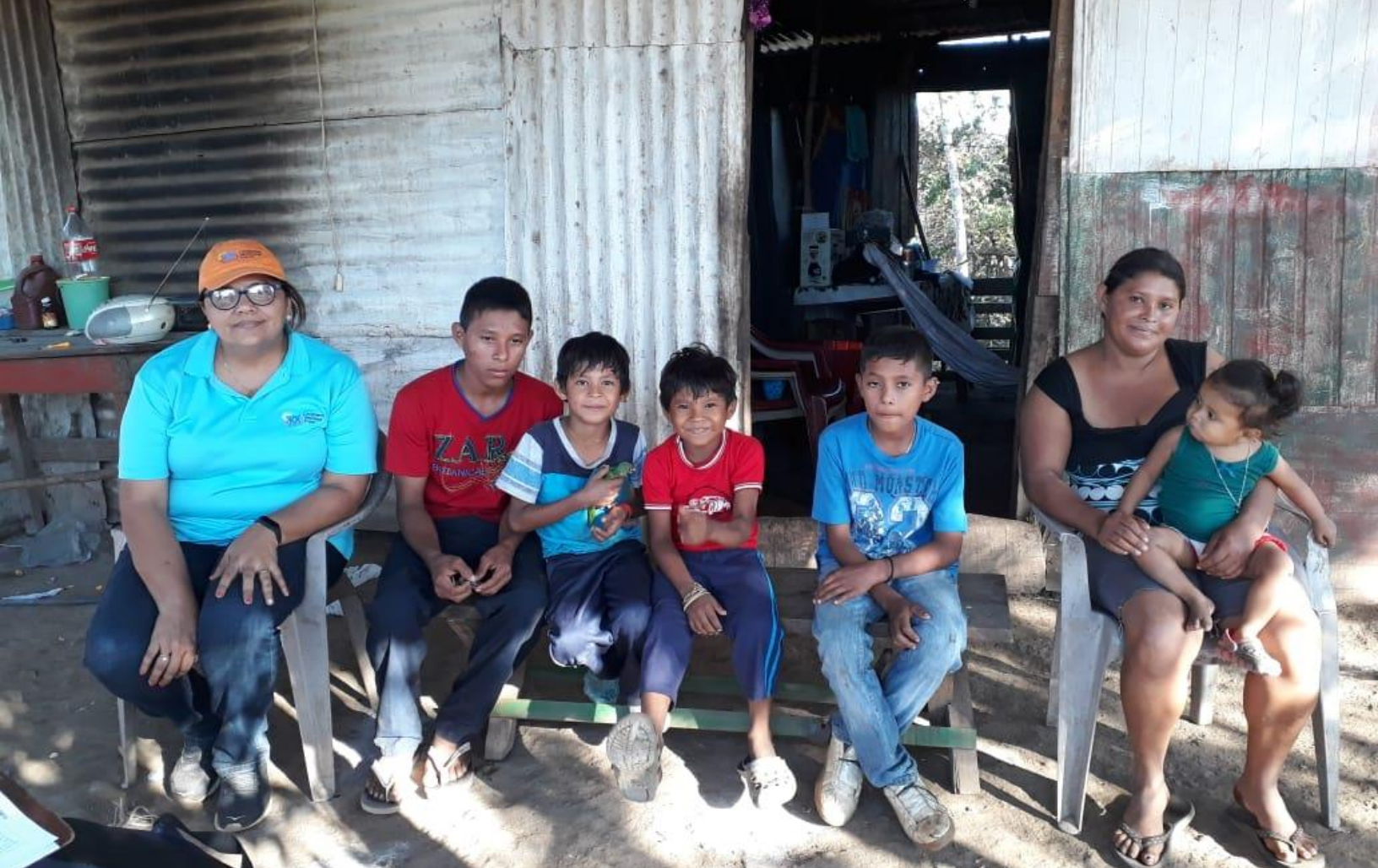
Tres escenarios de nuestro trabajo comunitario. Arriba: visita familiar de seguimiento de psicología. Abajo: Peso y Talla como parte de la Vigilancia y promoción del crecimiento y desarrollo durante visita de terreno en La Prusia, y entrega de paquete alimenticio en Aguas Agrias