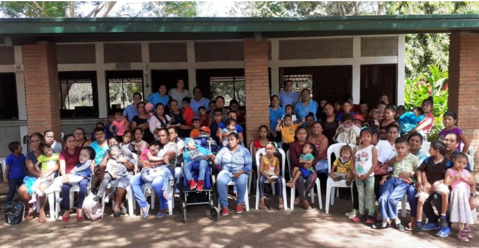
Beneficiarios del programa de atención integral a menores con discapacidad participando en actividad de integración por el inicio de actividades del año 2020 en JACS