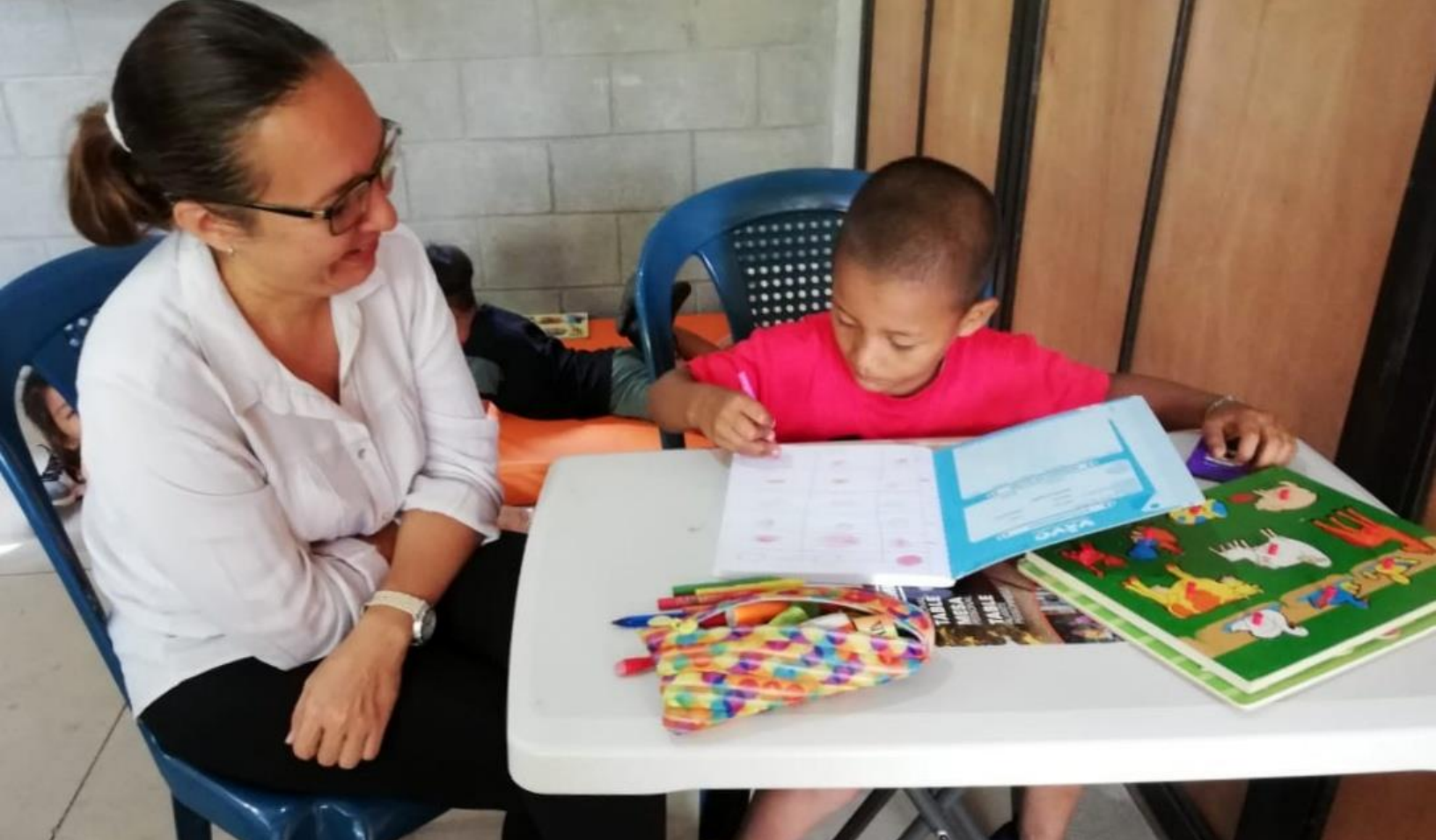
Menores que reciben atención en terapia del lenguaje en JACS