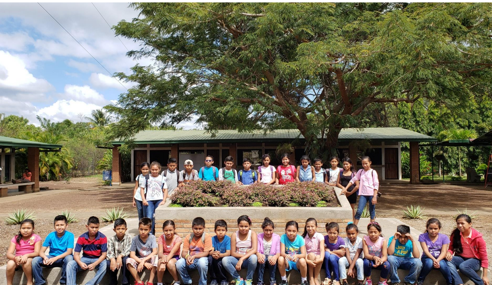
Actividades de integración por el inicio del ciclo 2020.

Nuestra matrícula 2020 es de 211 usuarios divididos en Primaria: 143 y Secundaria: 68, con una asistencia promedio de 178 menores por día quienes reciben los servicios de alimentación, clases de inglés, computación, deportes, artes y reforzamiento escolar