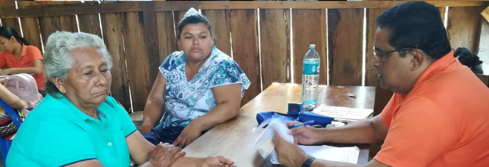
Pacientes del programa de Dispensarizados atendidos en las Comunidades de Dolores del Lago, El Manchón, La Prusia y Aguas Agrias.