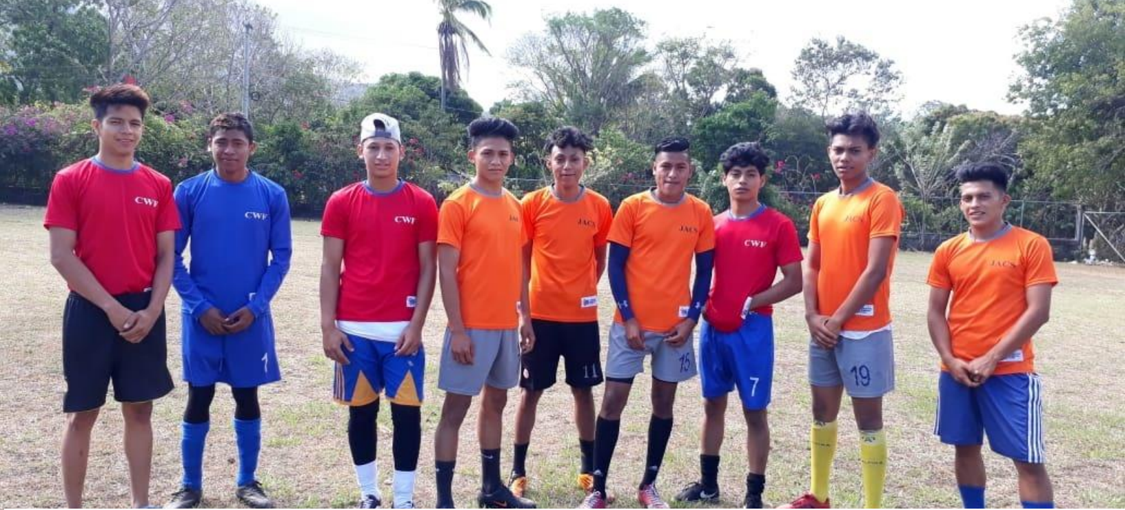
En imágenes. Equipo de fútbol CWF, Actividades recreativas con menores, Elaboración de piñatas y Visita guiada a la Biblioteca Municipal en Granada.