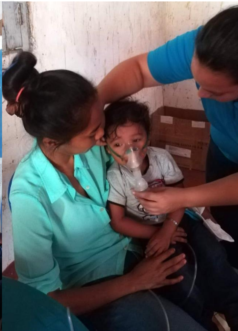
Entrega de medicinas en la Prusia, atención a enfermedad respiratoria en Dolores del Lago y peso y talla a escolares de primaria de Aguas Agrias.