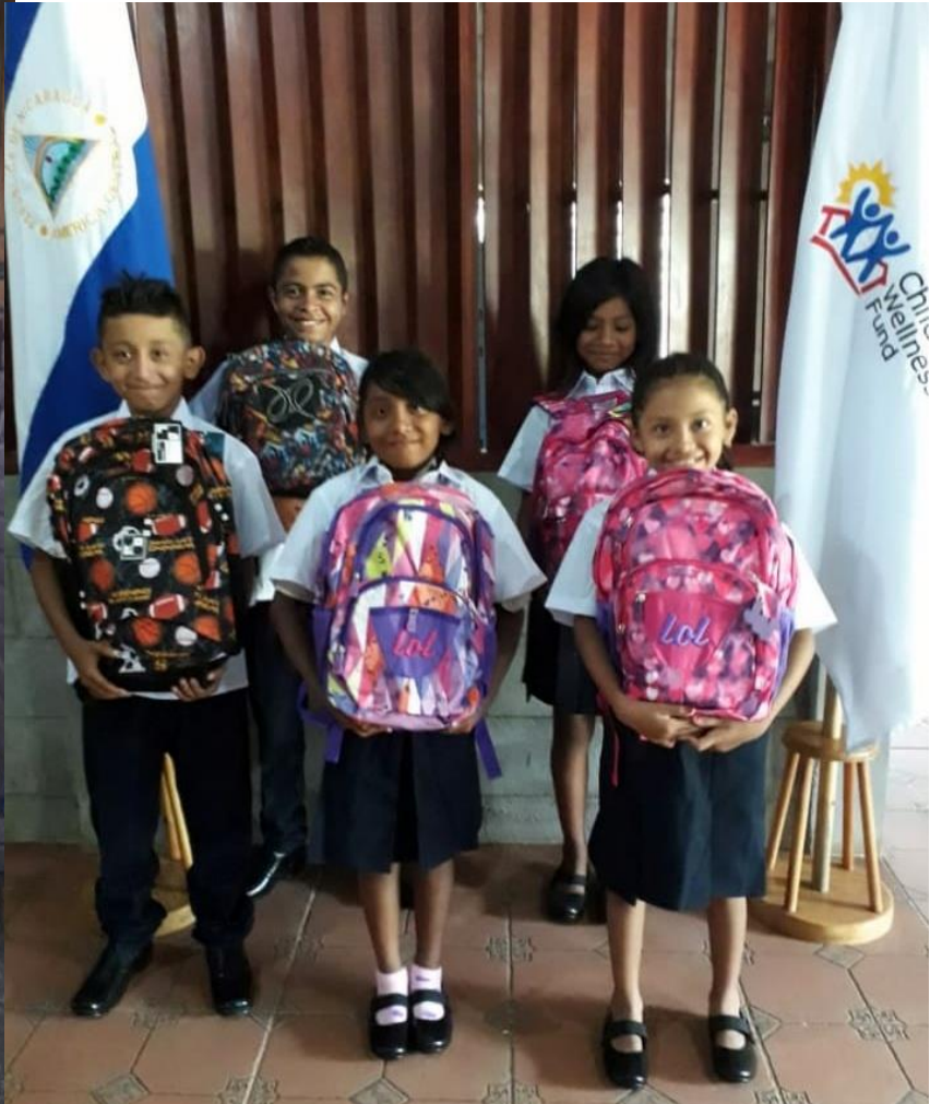
Entrega de uniformes y mochilas a menores beneficiarios de Basurero de Nandaime