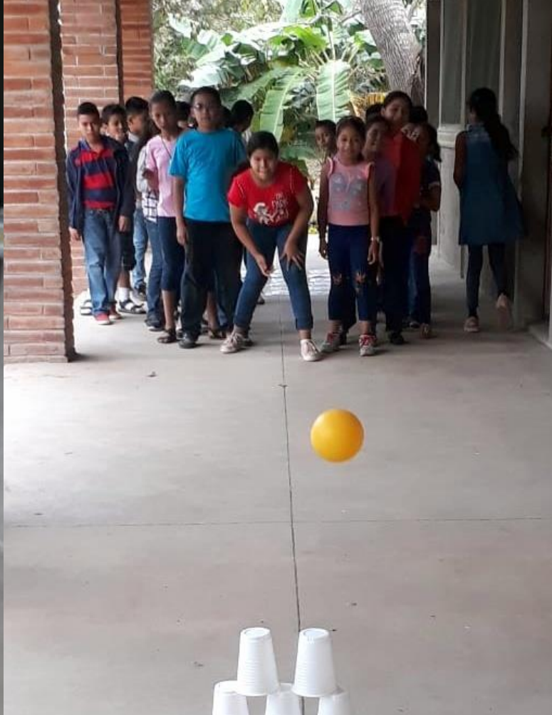
Favoreciendo el aprendizaje a través de métodos lúdicos que nos ayudan a la vez al desarrollo de habilidades motoras, de concentración, a trabajar en equipo y establecer liderazgos dentro de la tarea.