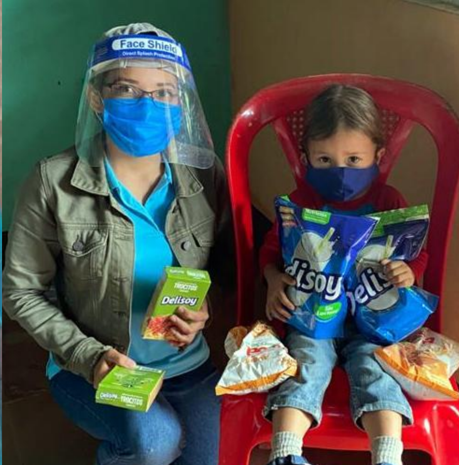
Menores del programa de Fortalecimiento Nutricional y Niños con discapacidad durante la entrega de paquetes alimenticios