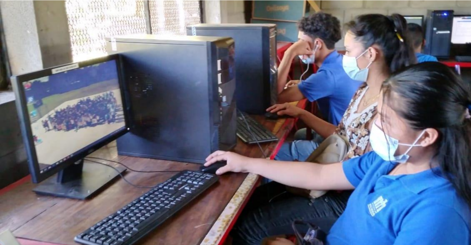
Arriba: Clases de computación, Abajo: Clases de matemáticas