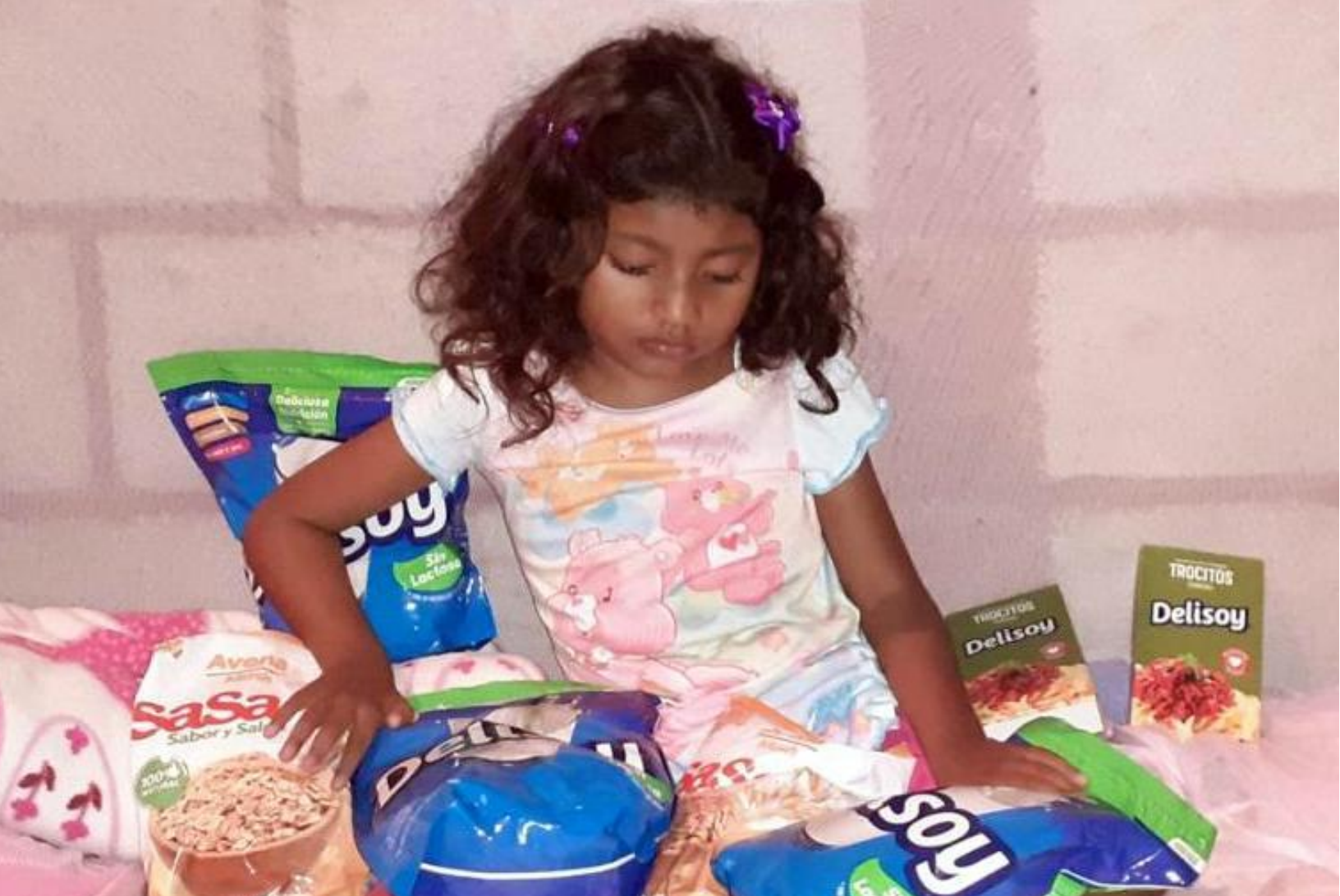
Menores del programa de Fortalecimiento Nutricional y Niños con discapacidad en sus hogares reciben paquetes alimenticios por medidas de protección y seguridad por el COVID19