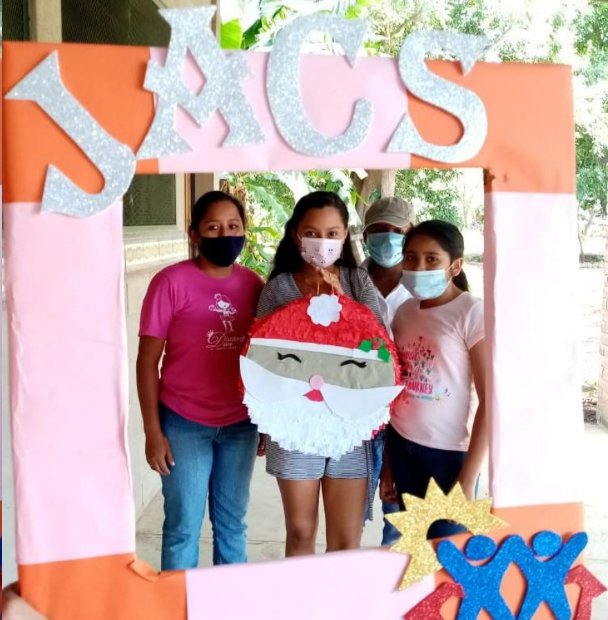
Productos finales del taller de elaboración de piñatas Curso de verano JACS 2020