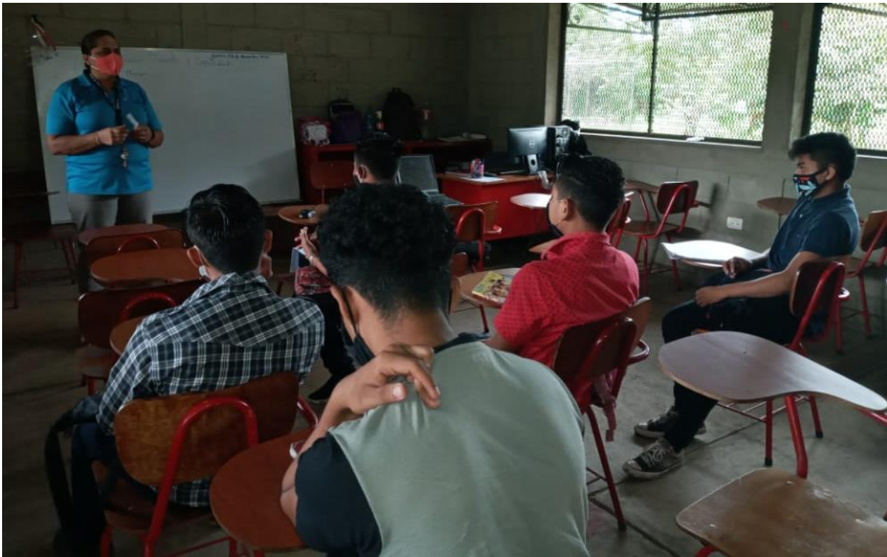
Arriba: Charlas de Orientación Vocacional, Abajo: Realización de test vocacional.

solicito a las madres que entregaran fotocopia de los boletines escolares, así misma constancia de matrículas en algunos casos, con el objetivo de garantizar evidencias de la permanencia del NNA en la escuela.