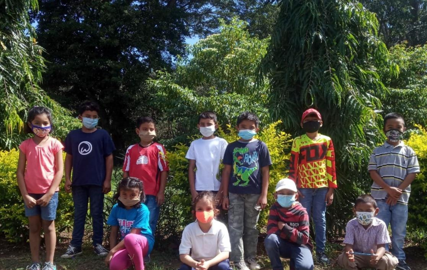
Arriba: Actividad de integración al aire libre, Abajo: Taller de elaboración de Manualidades